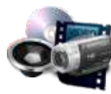
áudio e vídeo